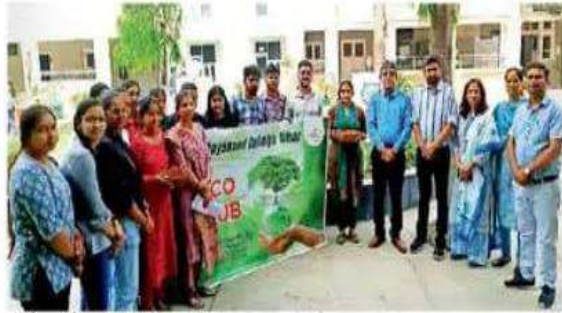
सकोरा-घोंसला अभियान की शुरुआत करते विद्यार्थी व अन्य सदस्य।

उन्होंने विद्यार्थियों को अपने आसपास के वातावरण को समृद्ध बनाने तथा पक्षियों व आवारा पशुओं के लिए पानी और भोजन की व्यवस्था करने के लिए प्रेरित किया। इको-क्लब