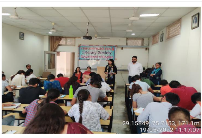
Essay Writing Competition held on 19 th May 2022