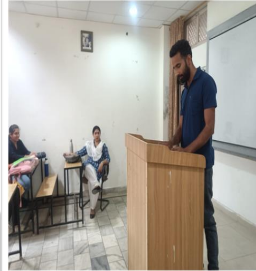
Glimpses of the Paper Reading Competition