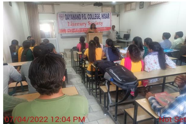
A talk session on the importance of Soft Skills