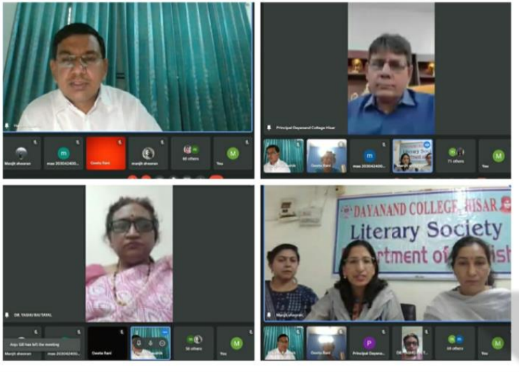
Webinar organized by the Literary Society, Department of English