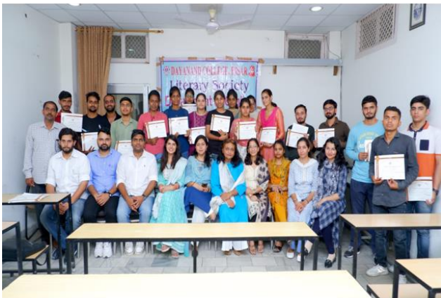
With the prize winners and the participants of the Essay Writing Competition