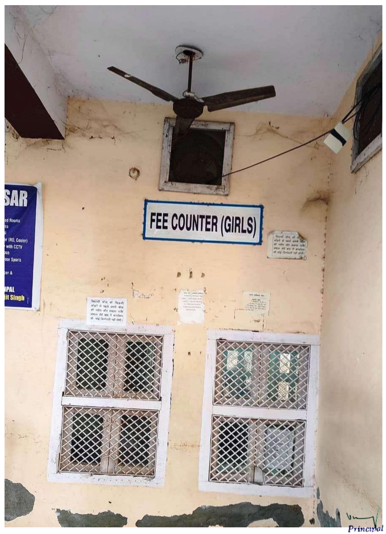
Dayanand College. HISAR