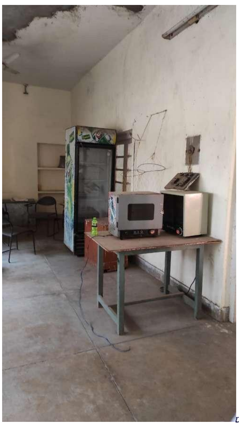
Principal Dayanand College. HISAR