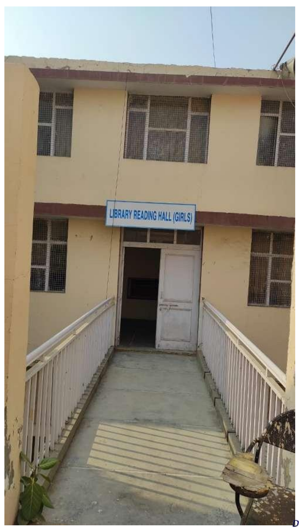
Principal Dayanand College. HISAR