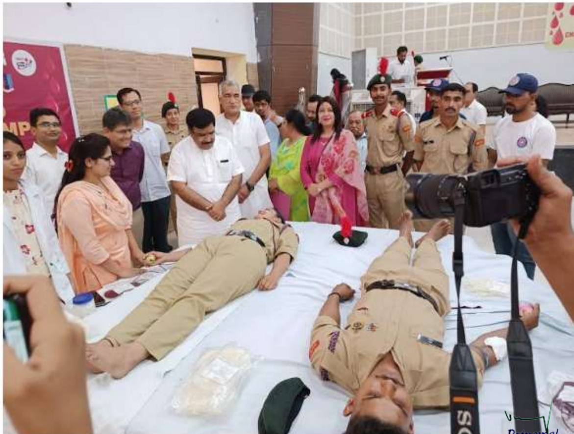
Principal Dayanand College. HISAR